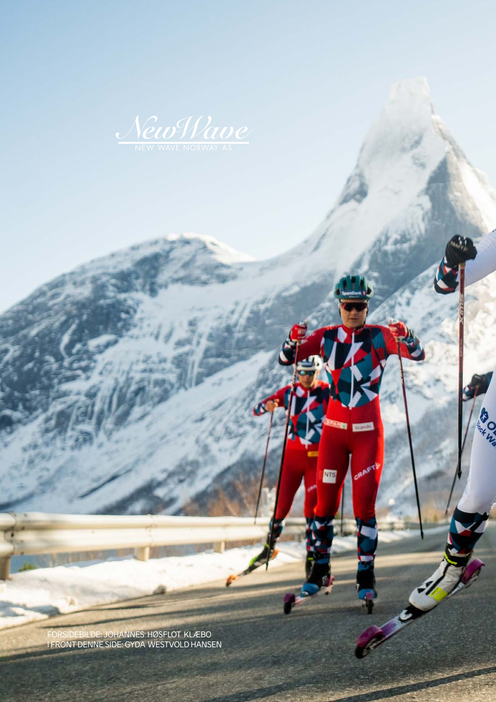
FORSIDEBILDE: JOHANNES HØSFLOT KLÆBO I FRONT DENNE SIDE: GYDA WESTVOLD HANSEN